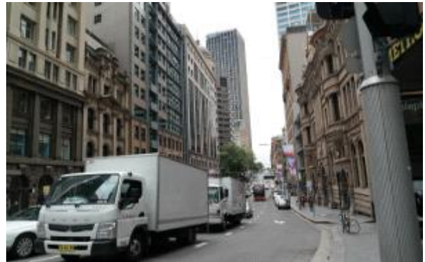
신·구 건물의 조화로운 도시 개발