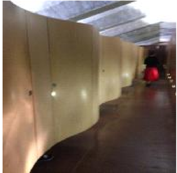
물결 형태의 화장실 칸막이