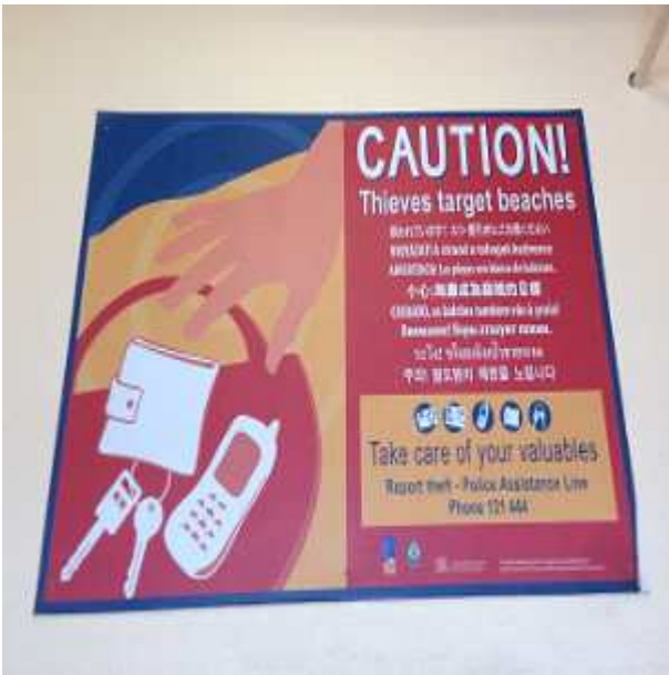
각국 언어로 표기된 관광지 안내판