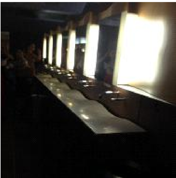
파도를 형상화한 세면대 디자인