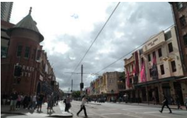
신·구 건물의 조화로운 도시 개발