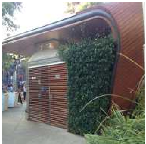
화장실 및 시설물 디자인