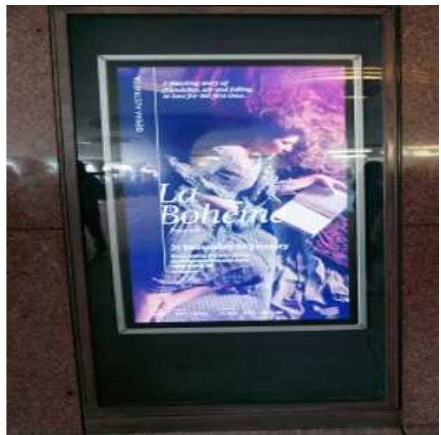
외부 벽면 홍보용 LED 패널