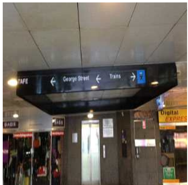
지하도 사각형 안내판