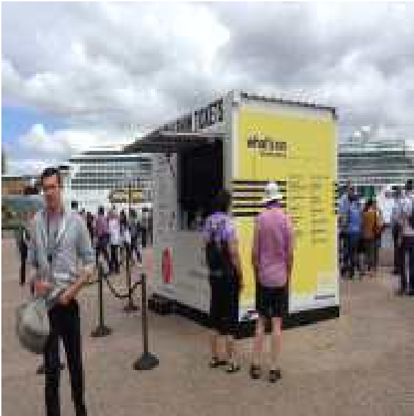
오페라 하우스 외부 박스오피스