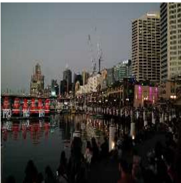
달링하버 주말 불꽃놀이 관람객