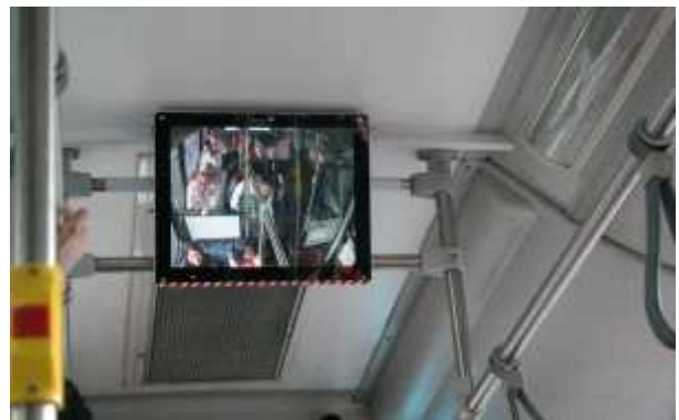
버스 내 승객 모니터링 시스템