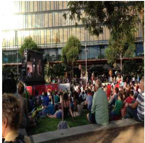
주말 영화 야외상영중인 달링하버