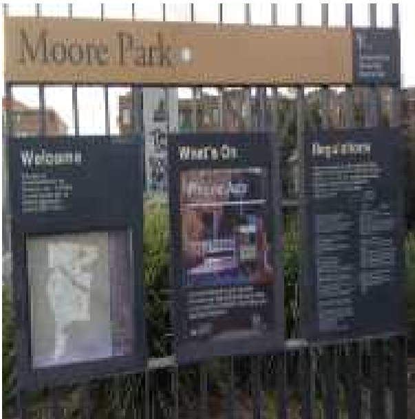
공원 안내 게시판 및 전용 앱 안내