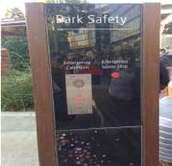
공원 내 비상연락 시스템