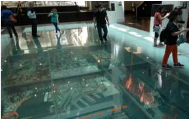
시드니 도시 개발 마스터플랜 모형